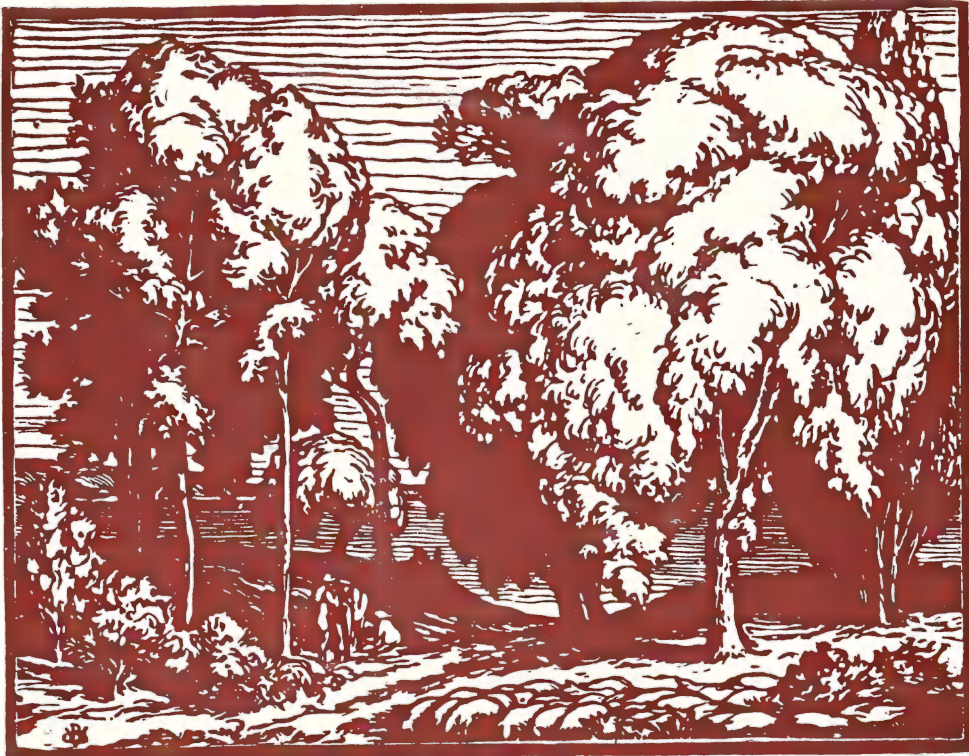
Une composition de J.-B. VETTNER.